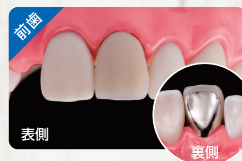
従来のかぶせもの