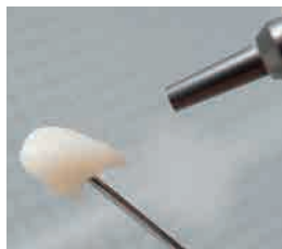
表面処理(粒径25~50μmの アルミナ、噴射圧0.2MPa以下)