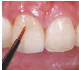
キャラクタライズ