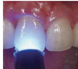
光照射 (40秒/G-ライトプリマII PLUS)