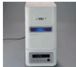
光重合 (90秒/ラボライトDUO)