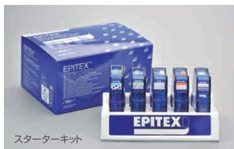
スターターキット