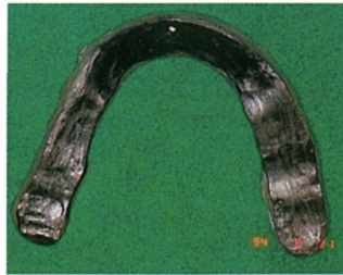
●マーカ * を均一に塗布したオクルーザルスプリント