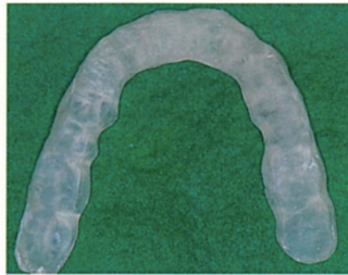
●完成したオクルーザルスプリント。

ファセットレジンは、ブラキシズムにより形成されたファセットの観察を容易に行うために開発されたオクルーザルスプリント用常温重合レジンです。特別な機器を用いることなく、オクルーザルスプリントが作製可能。優れた操作性と十分な強度、ファセット形成に最適な摩耗性によりファセットの観察が簡単、確実に行えます。