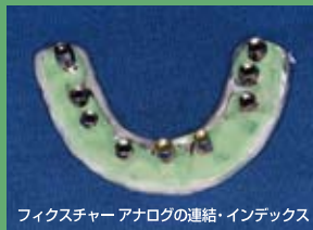
フィクスチャー アナログの連結・インデックス