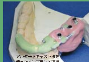
アルタードキャスト法を使ったインプラント連結