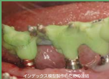
インデックス模型製作のための連結