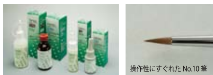
操作性にすぐれた No.10 筆