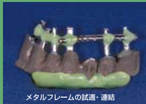
メタルフレームの試通・連結