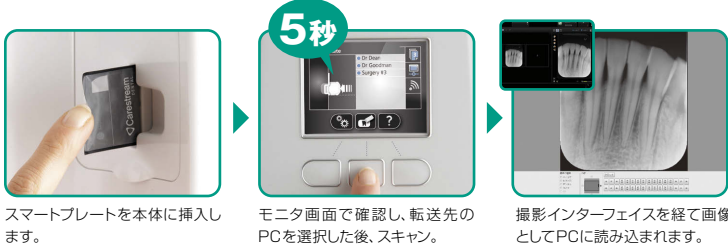
スマートプレートを本体に挿入します。

ジーシー-R 7600Dは高速モードスキャンでわずか5秒。診たいタイミングを逃さず、効率的な診療が行えます。