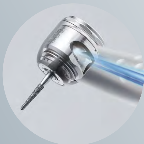
26Wの高出力 トルクヘッド S-SL