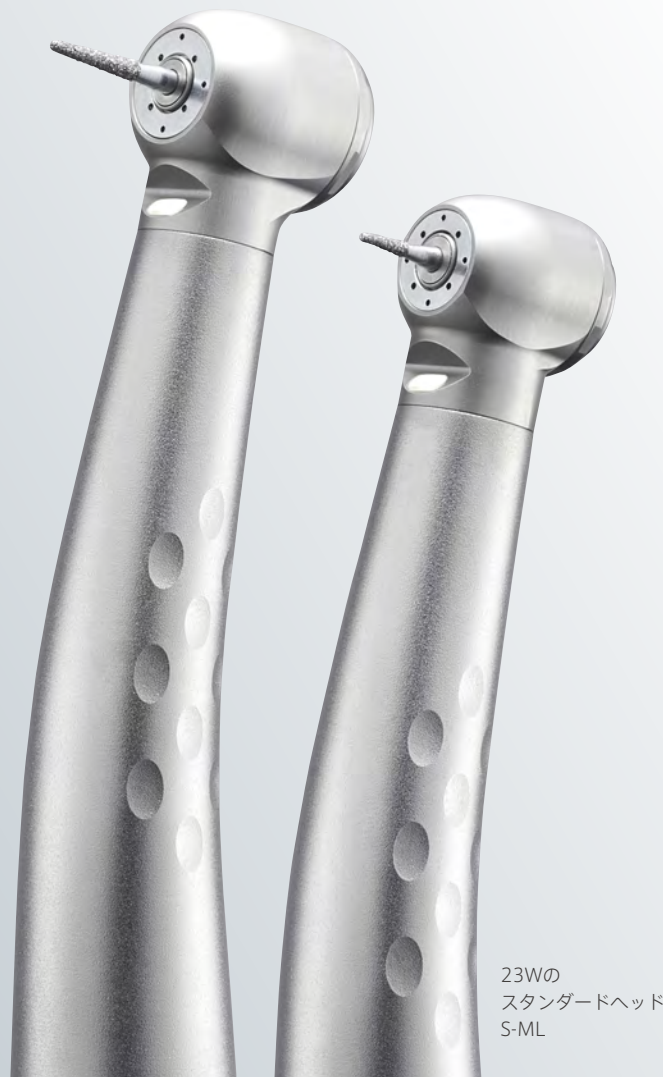
23Wの スタンダードヘッド S-ML