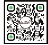
イニシャル製品の 詳細はコチラ