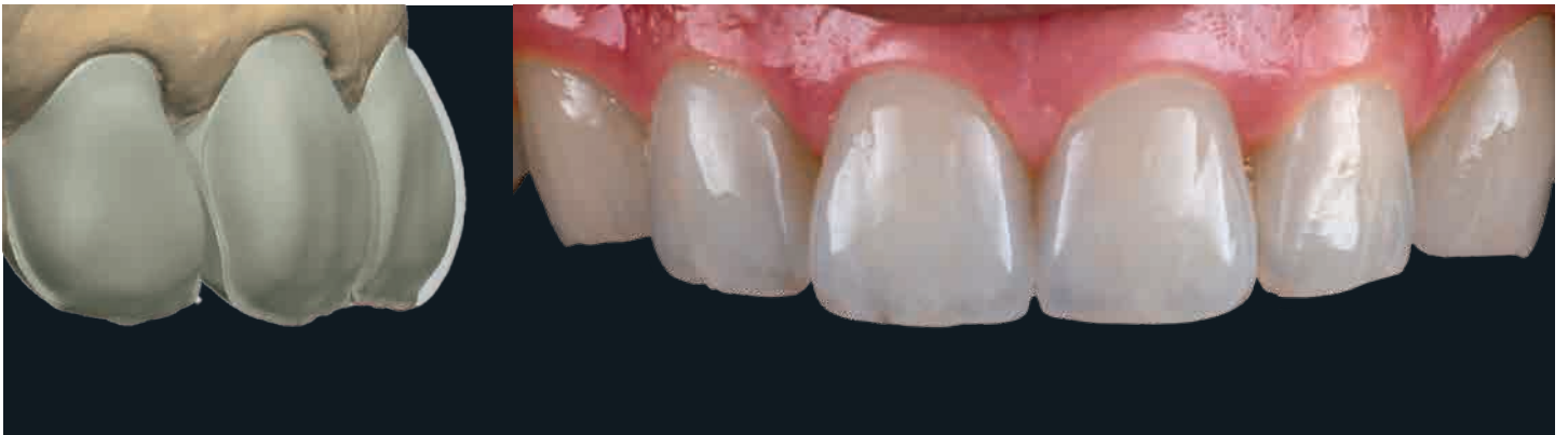
2 | 1 | 1、| 3 : セット後