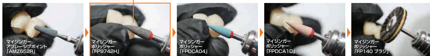
〈各ポリリッシャー研磨面の比較〉