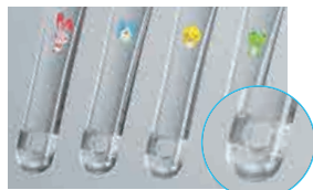
タイニーとスモールはハンドルに穴をあけました。