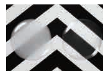
レギュラー (粗研磨用) ファイン (仕上げ研磨用)

種類 ● 2種:レギュラー(粗研磨用)/ファイン(仕上げ研磨用) 香味 ● レギュラー:ミント/ファイン:レモン 成分 ● (有効成分)レギュラー:モノフルオロリン酸ナトリウム(フッ素900ppm)、 ファイン:グリチルリチン酸ジカリウム、塩酸クロルヘキシジン、 フッ化ナトリウム(フッ素900ppm)