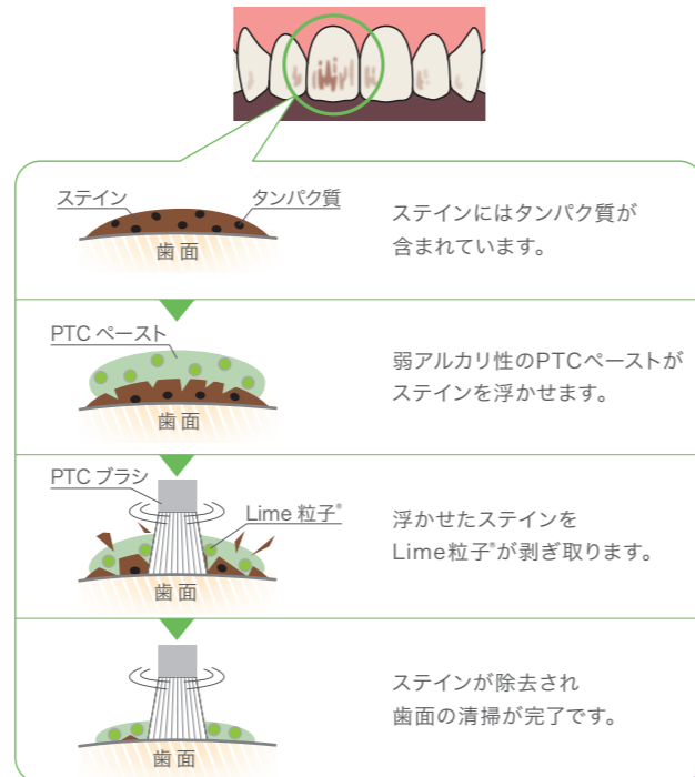
ステイン除去のメカニズム(イメージ図)