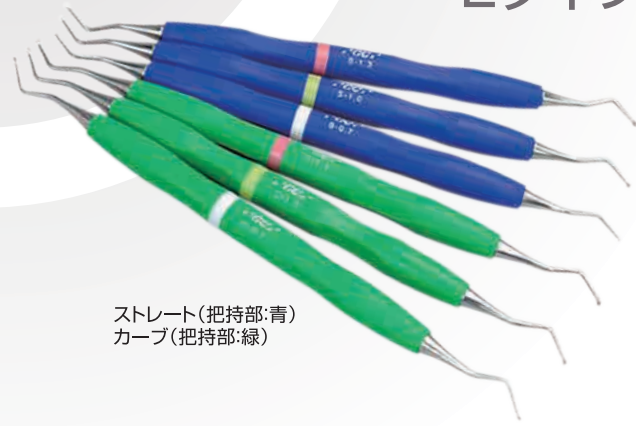
ストレート(把持部:青) カーブ(把持部:緑)