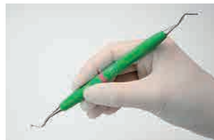
操作しやすい長さの把持部

術中の確実な操作のために、把持部には滑りにくいシリコンを採用。長さも操作しやすい長さに設定しました。