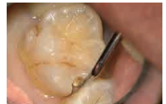
カーブによる 臼歯隣接面の軟化象牙質の除去 (C-O.7使用)