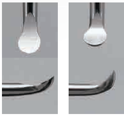
ストレート カーブ

ストレートとカーブの2種類の刃先により、届きにくい舌側面や遠心面などの軟化象牙質も容易に形成できます。