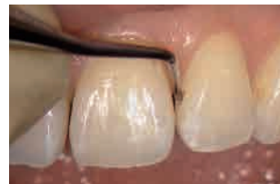
ストレートによる 前歯隣接面の軟化象牙質の除去 (S-O.7使用)

ストレートとカーブの2種類の刃先により、届きにくい舌側面や遠心面などの軟化象牙質も容易に形成できます。