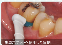
歯周ポケットへ使用した症例

歯周ポケットやインプラント周囲溝、補綴物周囲、また、歯間部にやさしく当て、清掃します。使用時の適正圧は、ブロービング圧と同等の20～25gです。