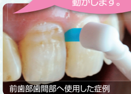
前歯部歯間部へ使用した症例

歯周ポケットや歯間部は、やさしく当て、ほうきで掃き掃除をするような軽やかなイメージで動かします。